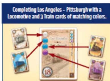
Завершенный маршрут Лос-Анжелес-Питтсбург: 3 карты + Локомотив

После того как заканчивается колода Вагонов, каждый игрок получает право последнего хода, включая игрока, который взял последнюю карту. Если в колоде осталась одна карты, игрок может взять ее в свой ход. В этом случае другие игроки могут выполнить оставшиеся возможные действия ( Взять карты Маршрутов или Поместить карты Вагонов в Депо ). После этого игроки открывают карты в своей стопке Железнодорожного Состава и приступают к построению Маршрутов. На каждой карте Маршрутов указано количество и цвет карт, которые необходимы для выполнения Маршрута. Каждая карта может быть использована только для 1 Маршрута. Локомотивы играют роль джокера и могут заменить любой цвет. Для людей, которые плохо различают цвета, в верхних углах карт содержатся специальные символы, обозначающие цвета.