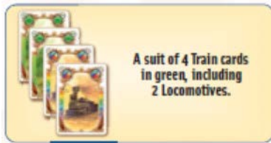
Группа из 4 карт Вагонов зеленого цвета, включая 2 Локомотива.

Если вы играете карты Вагонов различных цветов, то следует выкладывать 3 карты разного цвета. При этом в этой комбинации нельзя использовать Локомотивы. Игрок не может сыграть карту, если ее цвет уже есть в его Депо. Кроме того, игрок не может сыграть карты Вагонов тех цветов, которые уже есть в Депо других игроков, если он не сыграет такие карты в большем количестве. Если это происходит, то соперник должен немедленно убрать карты этого цвета из Депо в сброс. Эта ситуация называется «Ограбление поезда»